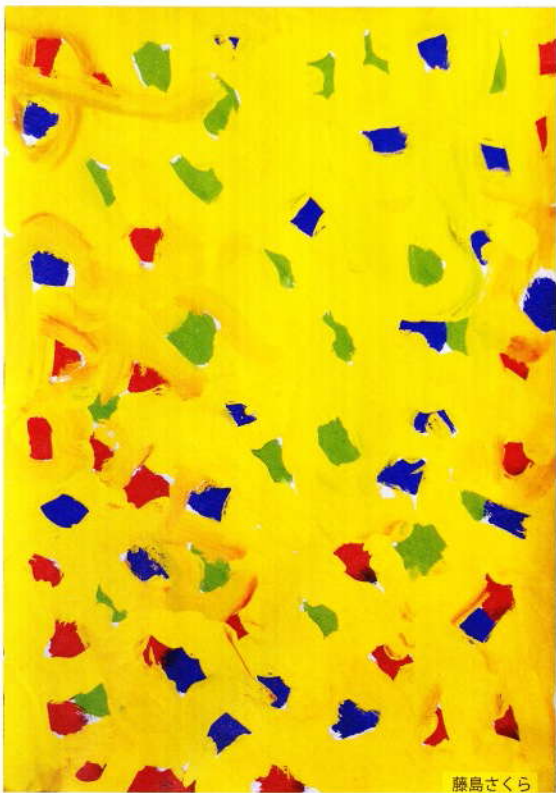
藤島さくら 6歳1ヶ月 大矢野あゆみ保育園