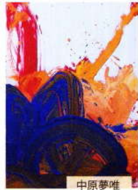
中原夢唯 3歳1ヶ月 べっぶ里山こども園