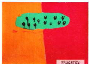
熊谷紅咲 6歳0ヶ月 若狭町立気山保育所