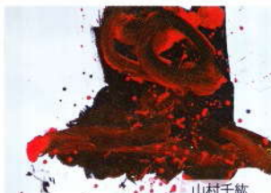
山村千紘 2歳7ヶ月 大野市立阪谷保育園