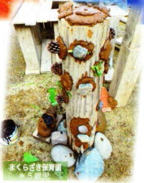
まくらざき保育園 *5歳児