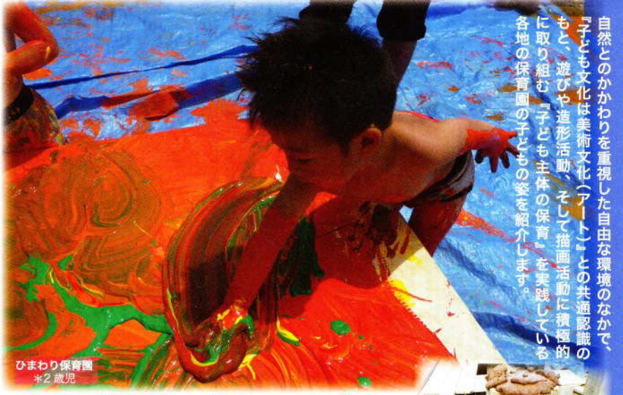
ひまわり保育園 *2歳児

自然とのかかわりを重視した自由な環境のなかで、『子ども文化は美術文化(アート)』との共通認識のもと、遊びや造形活動、そして描画活動に積極的に取り組む『子ども主体の保育』を実践している各地の保育園の子どもたちの姿を紹介します。